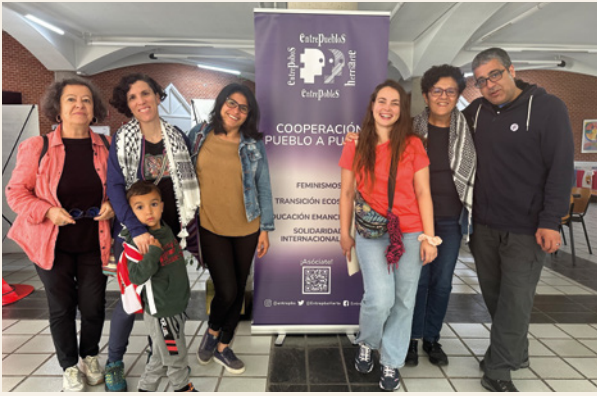
Activistes d'Entrepobles a Múrcia i Alacant