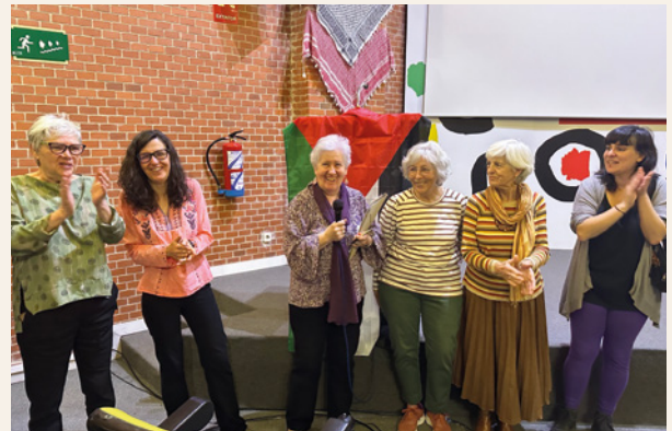
Part de l'equip d'Entrepobles Madrid, que va organitzar l'Assemblea 2024