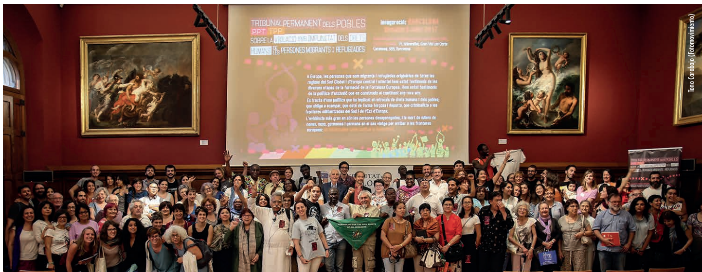
Acto de lanzamiento del TPP en Barcelona

El modelo capitalista neoliberal se articula actualmente en torno a la criminalidad y la impunidad. Los directivos de las empresas transnacionales más importantes del mundo y de la banca internacional reciben todos los honores a pesar de su papel en las crisis financieras globales y otros desastres que afectan al planeta.