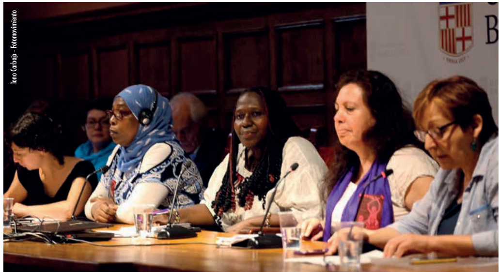
Acto de lanzamiento del TPP en Barcelona

Confiamos en que este proceso permitirá empoderar y dar mayor visibilidad a los Pueblos Migrantes